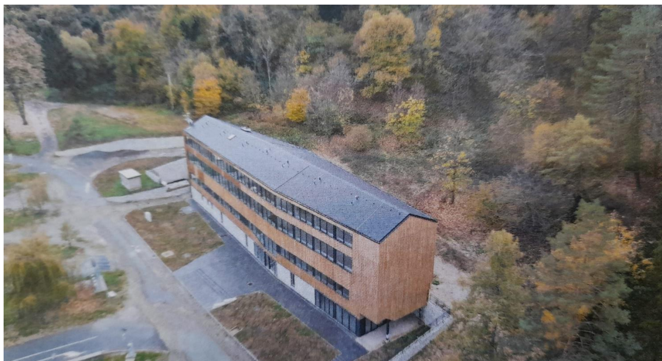
UŽA LOKACIJA GRADILIŠTA

Građevina je priključena na javnu prometnu i komunalnu infrastrukturu u Jezerskoj ulici – nerazvrstanoj cesti koja prolazi turističkim kompleksom i koja je na istoku priključena na županijsku cestu ŽC 4030 Orahovica-Kutjevo u Manastirskoj ulici na udaljenosti 700 m zračne linije.