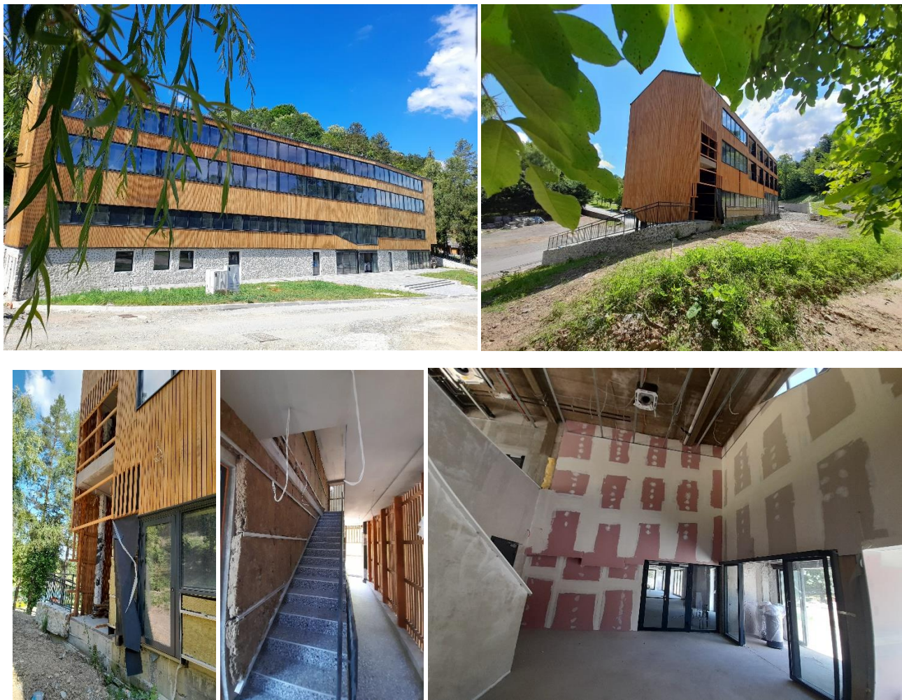
FOTOGRAFIJE PREUZETE GRAĐEVINE, 3.7.2024.

Elaborat o osiguranju dokaza. Grad Orahovica je zatražio osiguranje dokaza za izvedene radove od nadležnog suda, nakon čega je imenovani ovl. sudski vještak Damir Milobara, dipl.ing.građ., izvršio očevid i izradio Elaborat o siguranju dokaza oznake R1-13/2024 od kolovoza 2024. godine. U ispravi je elaborirano zatečeno stanje građevine.